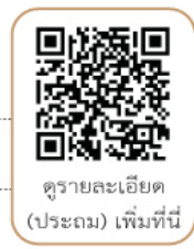
ดูรายละเอียด (ประถม) เพิ่มที่นี่

สอบถามรายละเอียดเพิ่มเติมได้ที่ โทร. 02-2794808 และ LINE ID : @bdnn