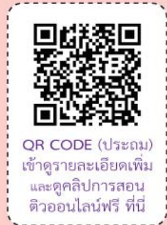
QR CODE (ประถม) เข้าดูรายละเอียดเพิ่ม และดูคลิปการสอน ตัวออนไลน์ฟรี ที่นี่

เปิด ตัวฟรี ครบทุกวิชา เตรียมสอบเข้า ม.1 และ ม.4 มี 5 วิชา คือ คณิตศาสตร์, วิทยาศาสตร์, ภาษาอังกฤษ, ภาษาไทย และสังคมศึกษา